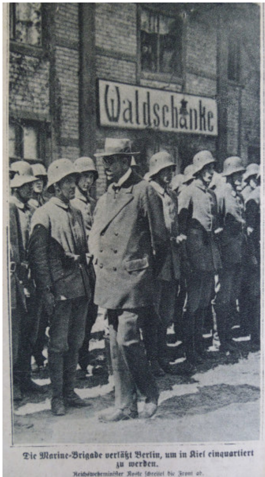
Foto 2 (Illustrierte Beilage der Kieler Neuesten Nachrichten, KNN, 1919, Nr. 23, S. 3)

Bildbeschreibung in der Beilage zu den KNN: